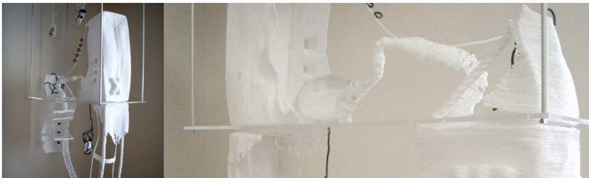
« En suspension », 120 x 70 x 25 cm - 2012

« Je travaille le blanc depuis toujours. Je veux des pièces sans "artifice", avec uniquement la matière brute. Je n'y ai pas de symbolique, ni d'ambiance, je recherche juste la simplicité. Le blanc est pour moi "instinctif", sans réelle explication.» EB